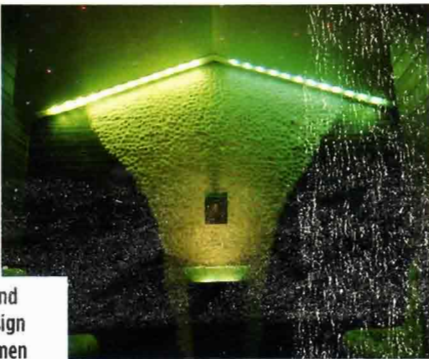
Licht- und Farbdesign bestimmen das extravagante Ambiente des Spas