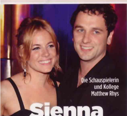
Die Schauspielerin und Kollege Matthew Rhys

Cameron & Jennifer Warum sie immer die Männer tauschen