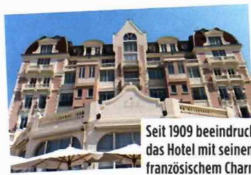
Seit 1909 beeindruckt das Hotel mit seinem französischem Charme

ergänzen das Angebot. Sportlich kann man sich beim individuellen Fitness-Coaching oder einer Partie Golf verausgaben.